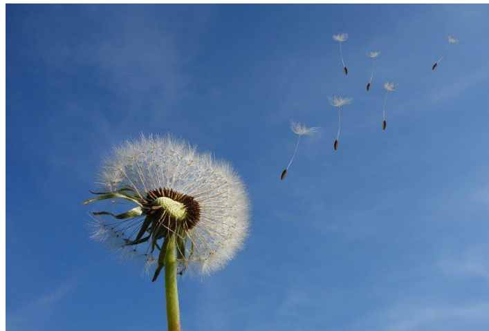
Pusteblume Löwenzahn Himmel - Kostenloses Foto auf Pixabay